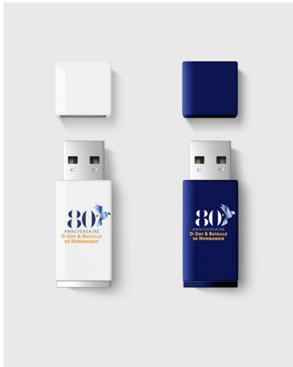
Application sur différents objets