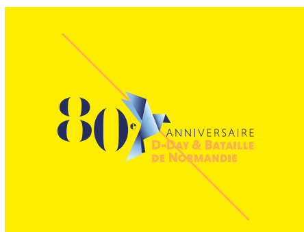
FOND NON NEUTRE