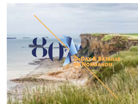
FOND PHOTOGRAPHIQUE COMPLEXE