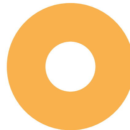
PANTONE 7548 U