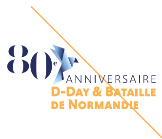
MODIFICATION DE PROPORTIONS