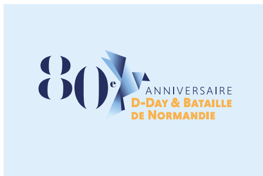
Utilisation en positif sur applat de couleur clair neutre

Cependant plusieurs types de fond sont autorisés.