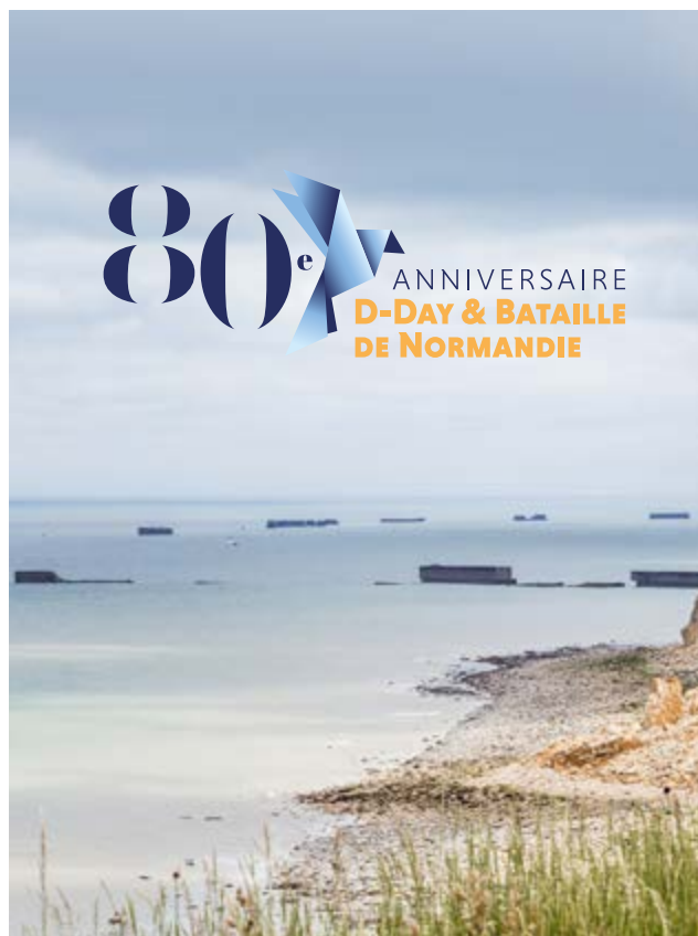
Utilisation sur une zone neutre photographique