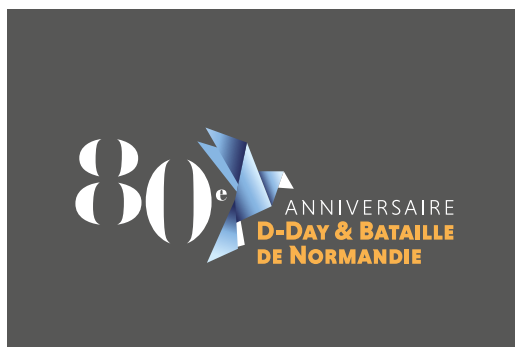
Utilisation en négatif sur applat de couleur foncé neutre