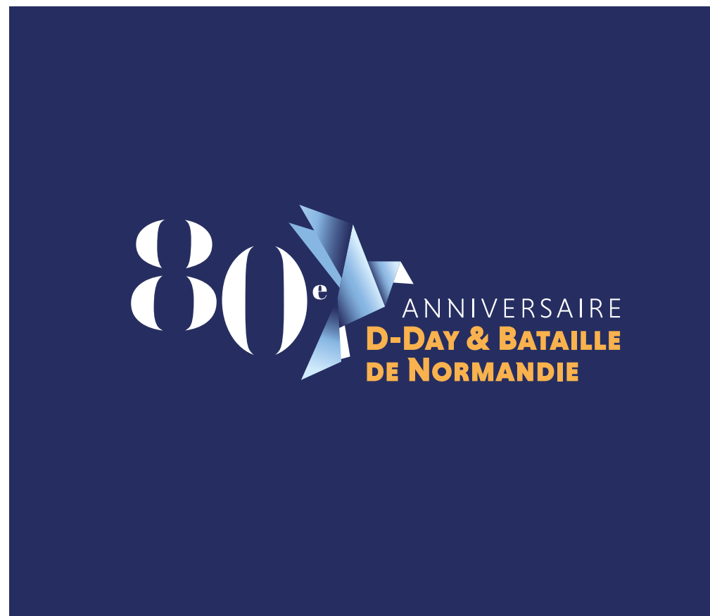
TRAITEMENT EN NÉGATIF