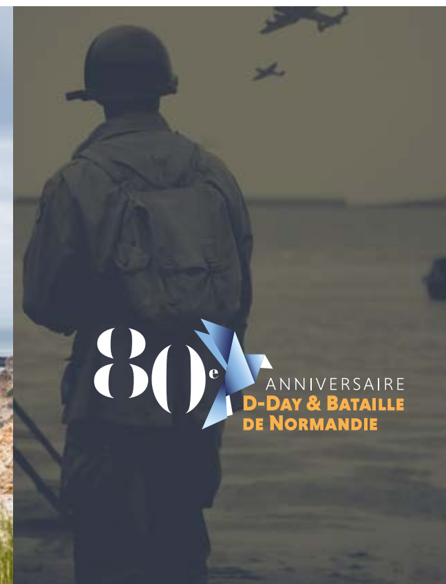
Utilisation sur une base photographique filtrée