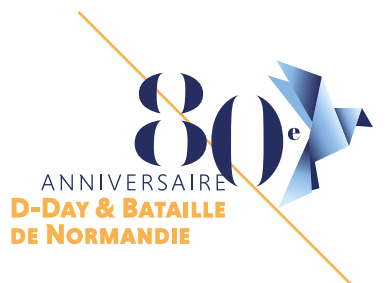
MODIFICATION DE STRUCTURE