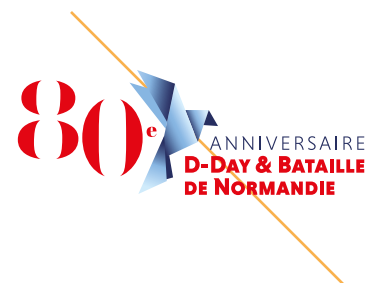
MODIFICATION DE COULEUR